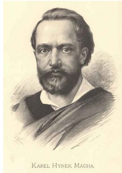
KAREL HYNEK MÁCHA